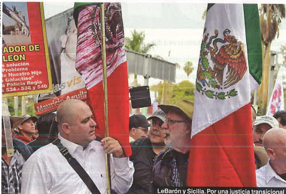
LeBarón y Sicilia. Por una justicia transicional

A principios de 2019 Sicilia se reunió varias veces con el subsecretario de Derechos Humanos de la Secretaría de Go-