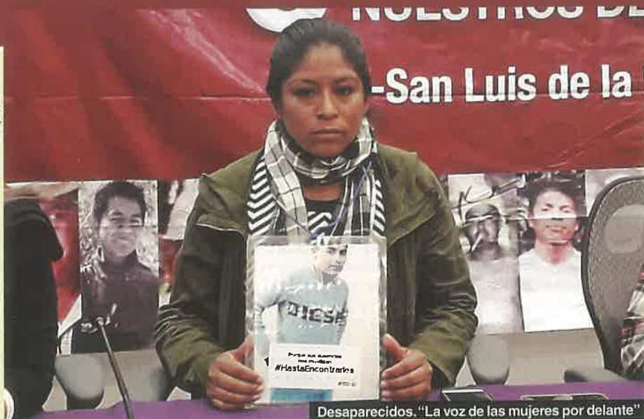
Desaparecidos. "La voz de las mujeres por delante"

rios de la fiscalía actuaron mal frente a los colectivos, la titular de la Comisión Nacional de Búsqueda, Karla Quintana, y el enviado de la Oficina del Alto Comisionado de la ONU-DH en México, Alan García Campos.